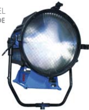
LTM 18KW DIA 628 mm