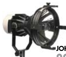
JOKER BUG 800