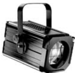
PLAN CONVEXE 1000 W