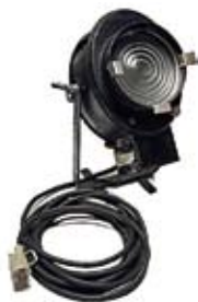
CREMER 500 W