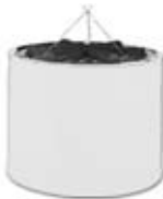
SPACE LIGHT 6KW